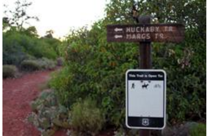
無数にあるトレイルの標識