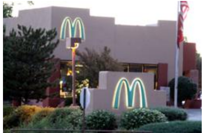
景観を損なわないように マクドナルドの看板は緑色