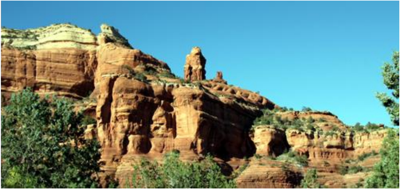
レッドロックの周りにエンチャントメントホテルが建つ