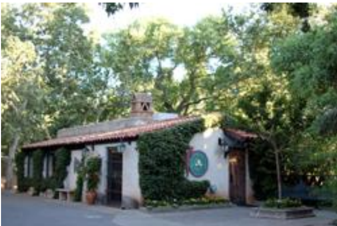
芸術家達による作品が買える ショッピングモールやレストラン