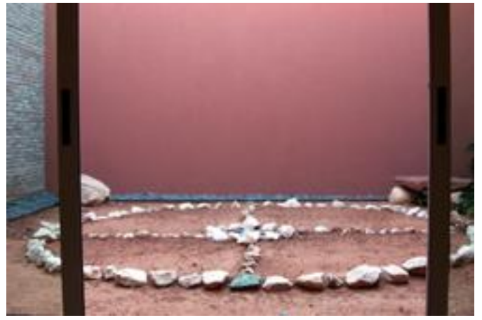
ホテル内・儀式で使うサークル