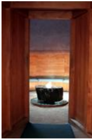
ホテル内にある 瞑想ルーム