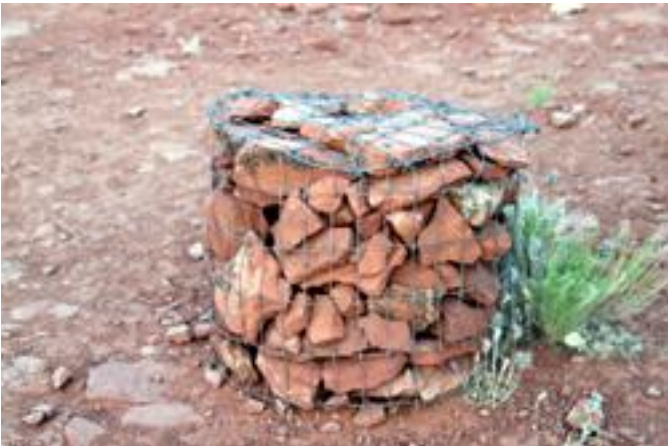
ハイキングトレイルにある道しるべ