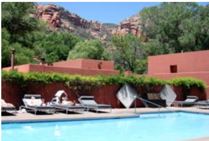
エンチャントメントホテルのプール