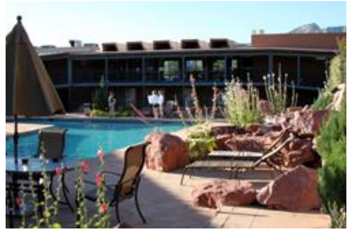
キングランサムホテル内の中庭風景