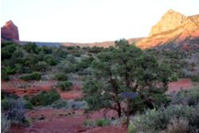
ハイキングトレイルの入り口