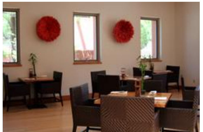
プールサイドのレストランはすべて有機野菜 を使ったメニューでヘルシー料理