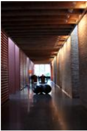
洗練されたオーガニック レストランへ続くコリドー