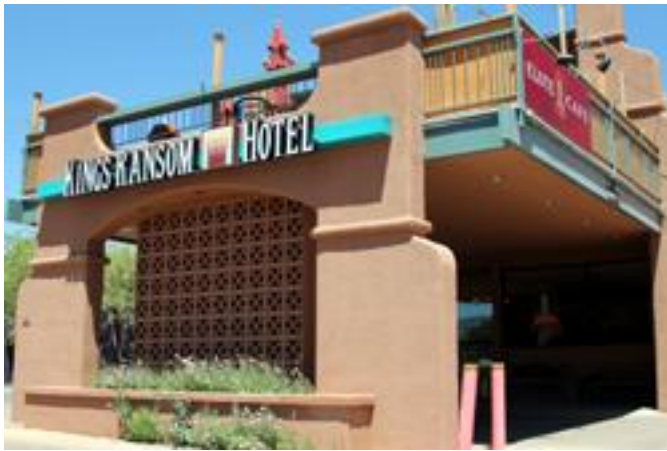
キングランサムホテル