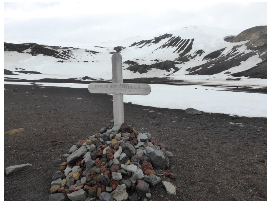
ノルウェー人のお墓