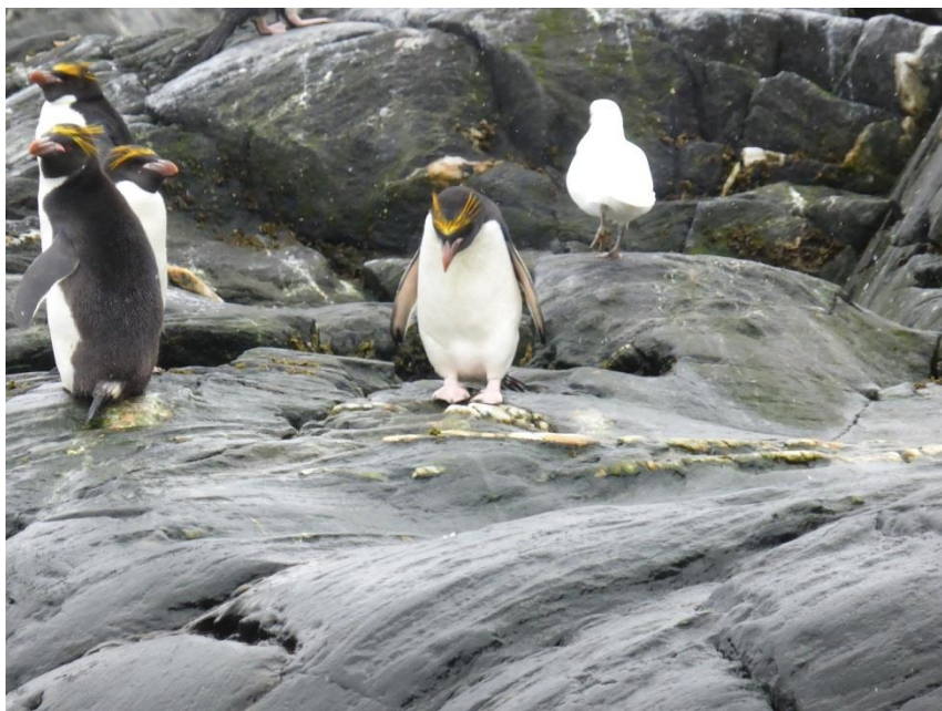
マカロニペンギン