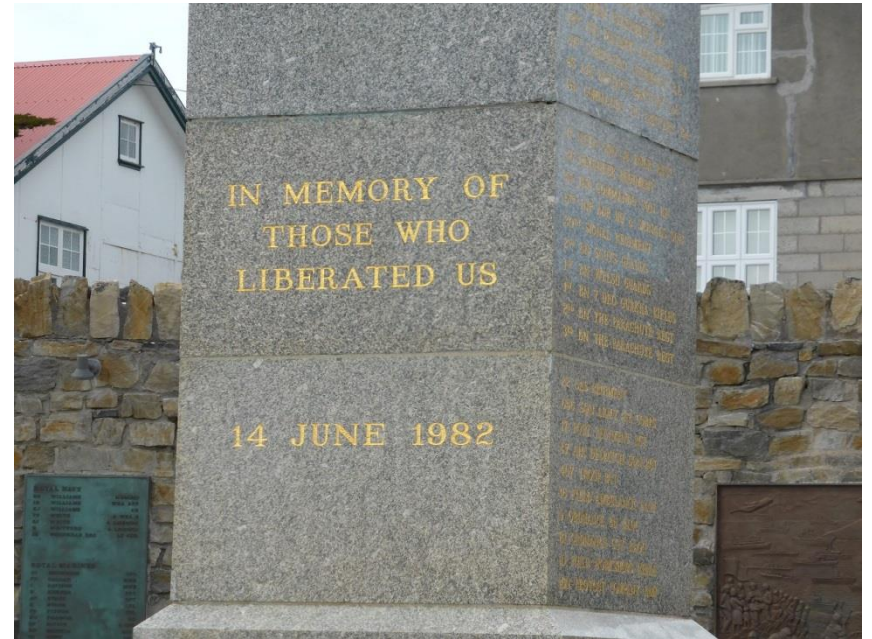
1982年のフォークランド紛争時のもの