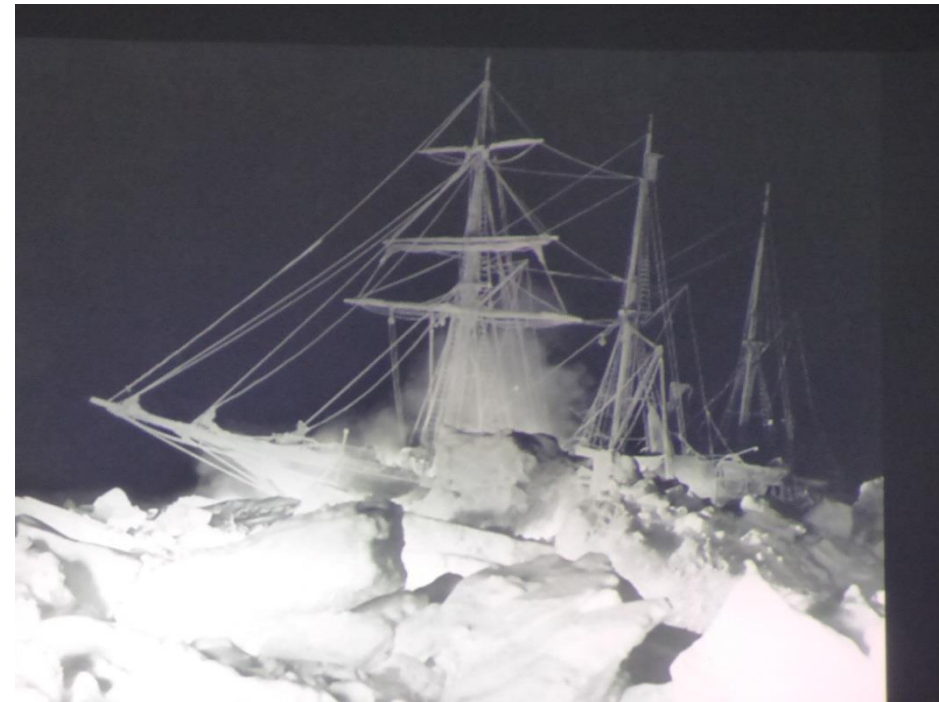
1916年氷に閉ざされたShackletonの乗った エンデュアランス号