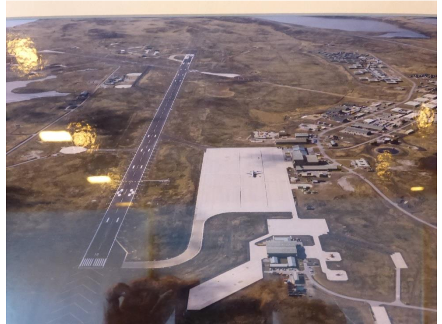
フォークランドの空港。 英国空軍の敷地内にある国際空港