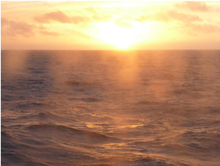
夜中12:00 太陽がしずんでも水平線まで