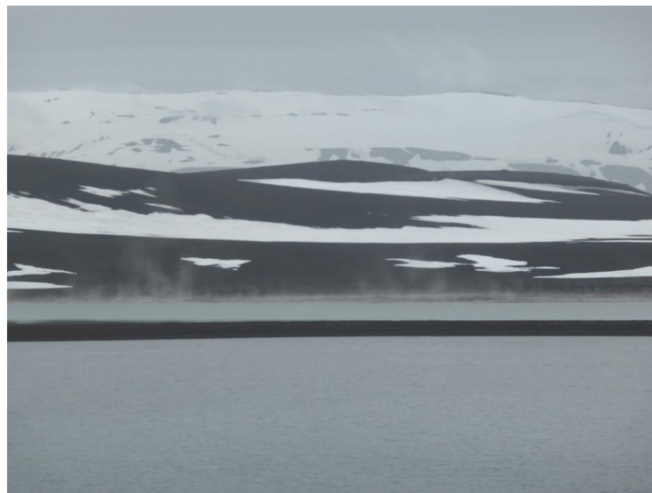
ディセプション島は古い火山の噴火口なので温泉が出ている。