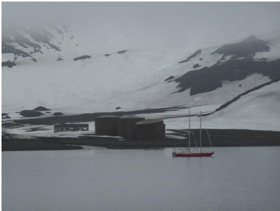
クルーズ中の帆船が停泊していた。