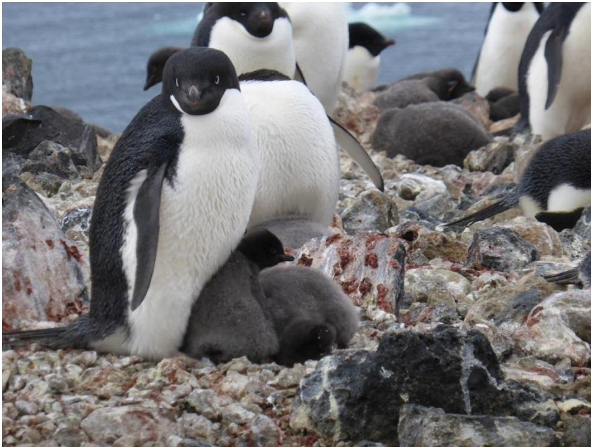
アデリーペンギン