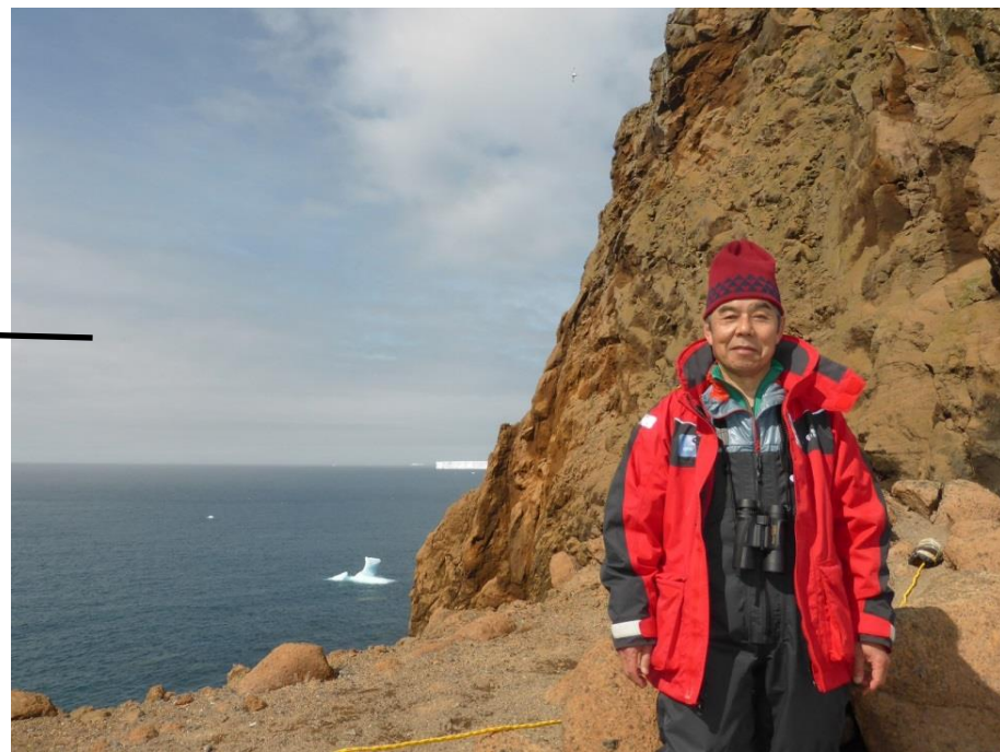
火口の一部に立つ