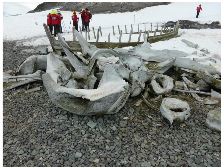
巨大なクジラの骨