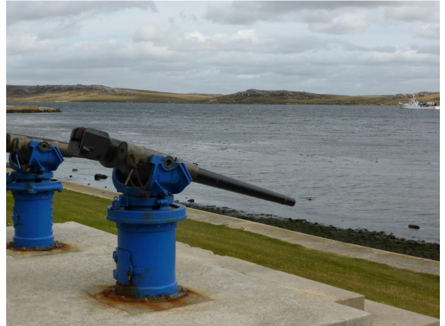
1982年のフォークランド紛争時のもの