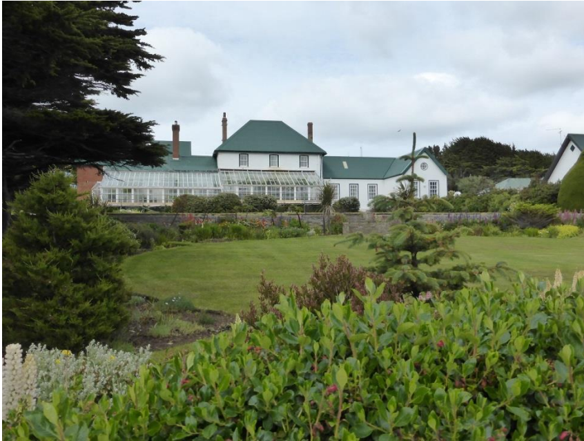
フォークランドは英国領で総督府が置かれている