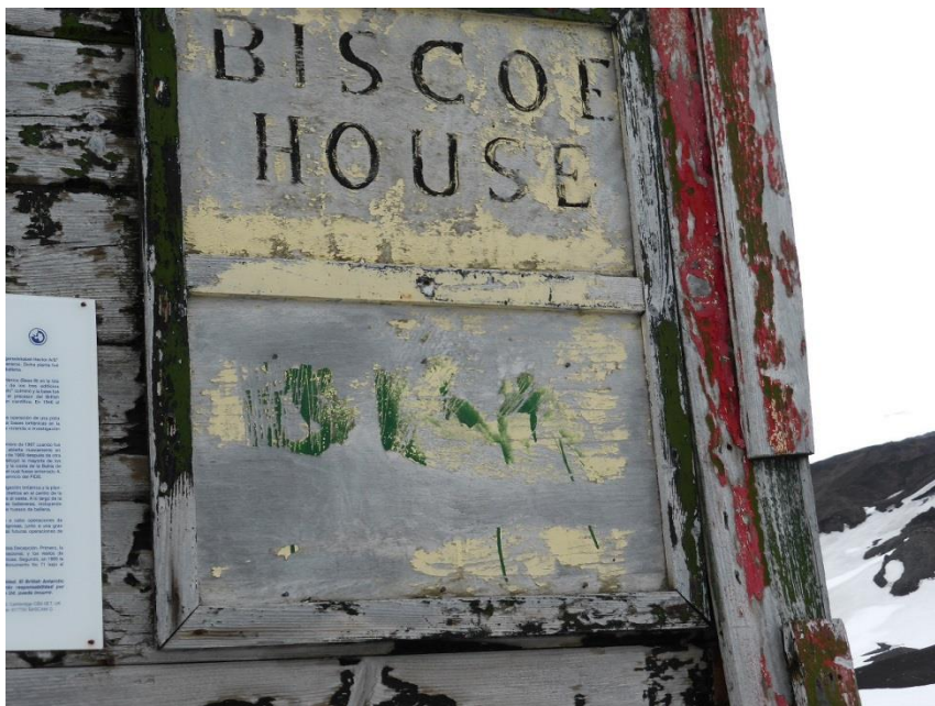
アメリカの鯨油の会社の名前(1800年代)