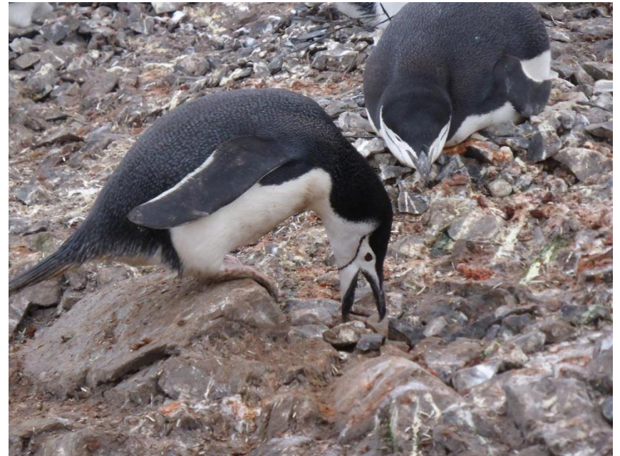
ヒゲペンギンの巣作り