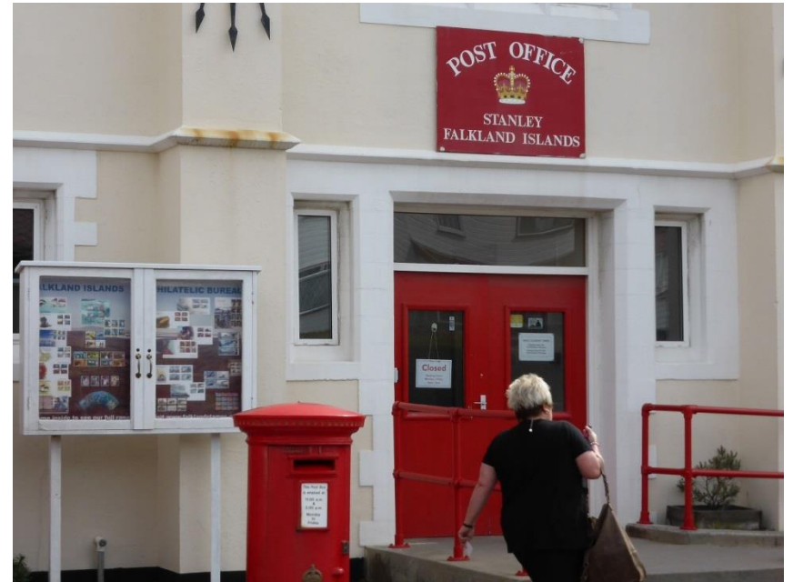
フォークランドの郵便局