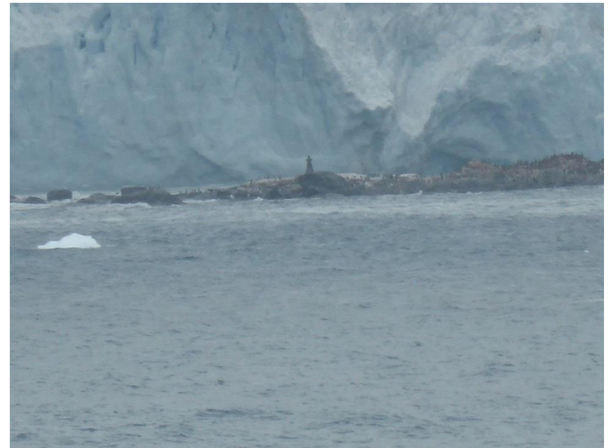
Elephant島のルックアウト岬に立つシャックルトン 遭難の記念碑