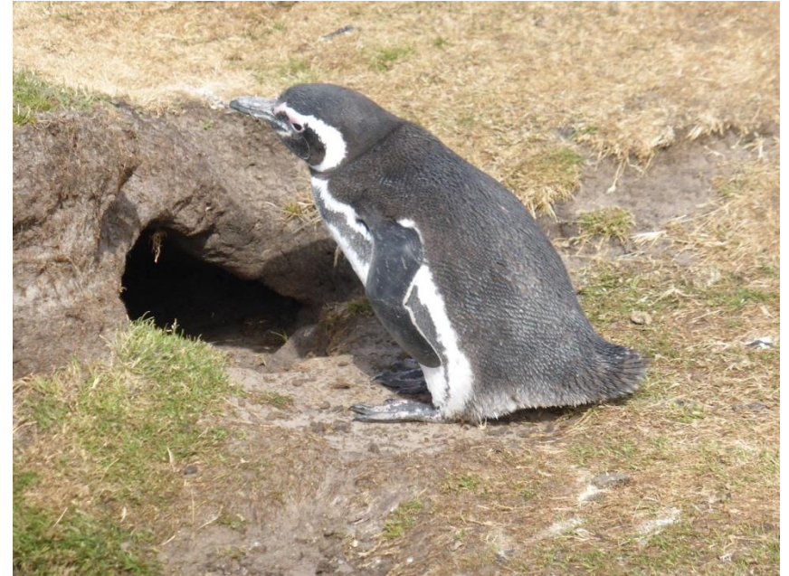
ペンギンはカモメの巣を利用して巣作りをする。