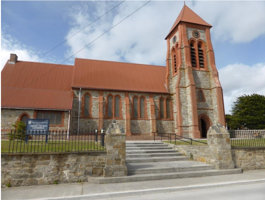
クライストチャーチ大聖堂