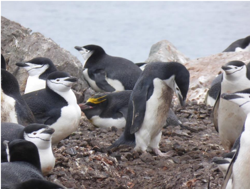
ヒゲペンギンの群れの中に1匹だけマコロニペンギンが混じっている。