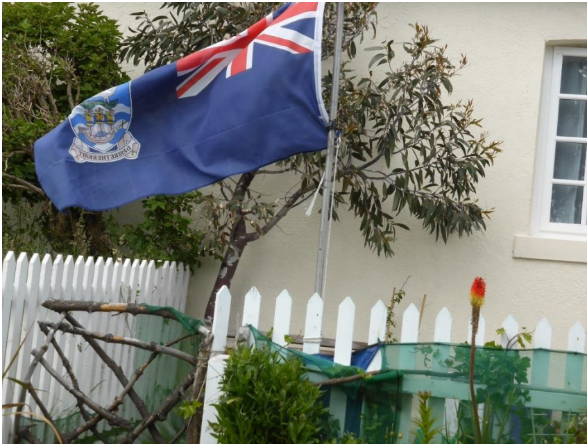
フォークランドの国旗