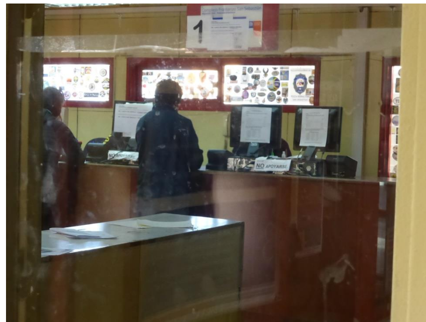
出国のための通関事務