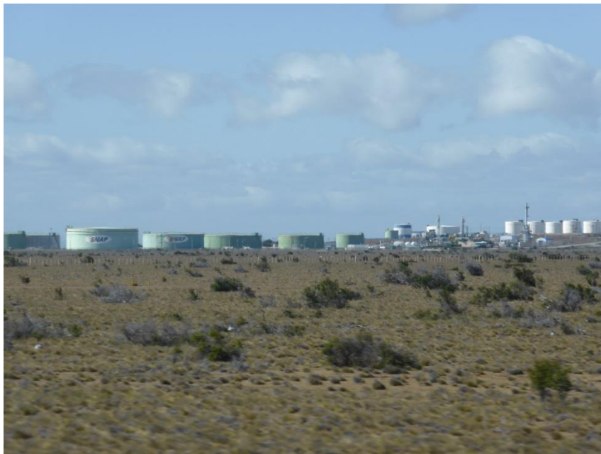
石油の備蓄タンクをあちこちに見かける