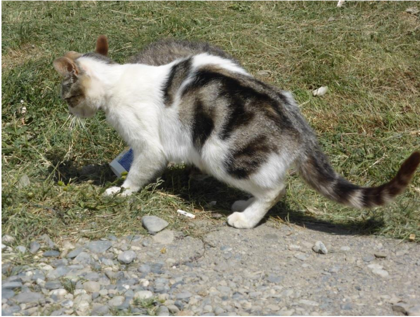
通関事務所のネコ