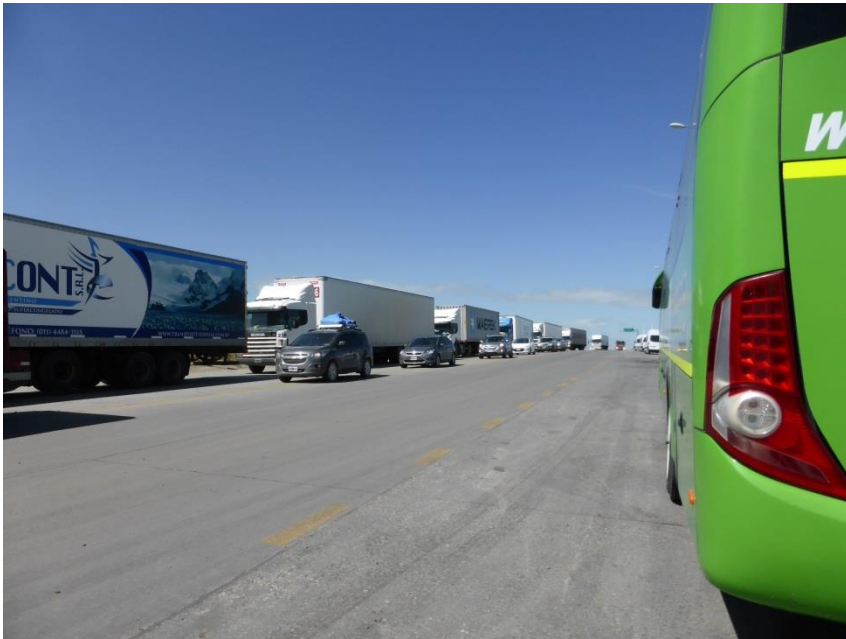
Punta Arenasへのトラック便が 上船を待っていた。