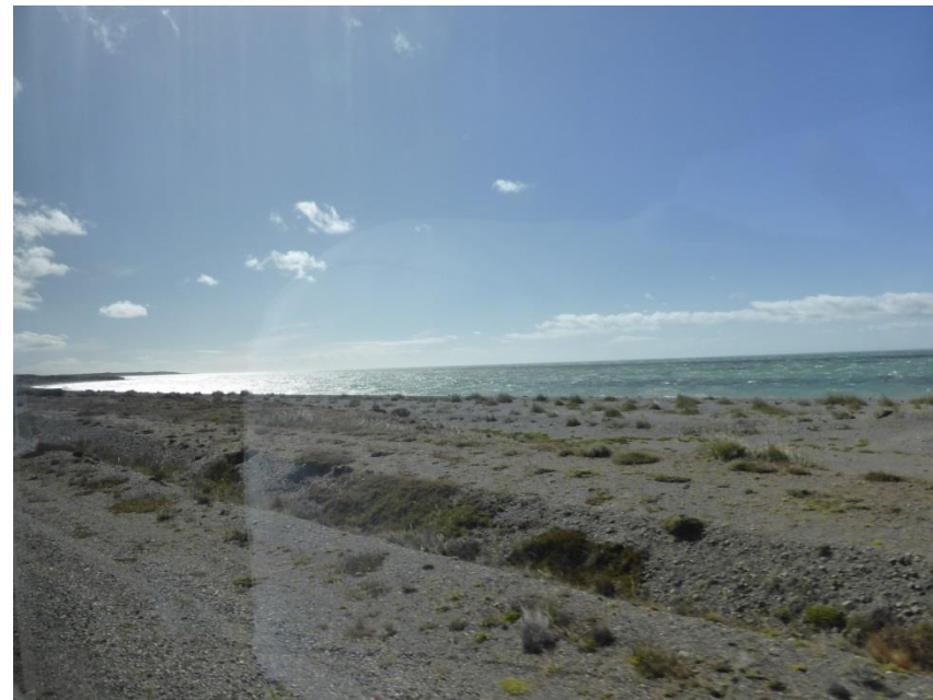
マゼラン海峡が見えてきた。