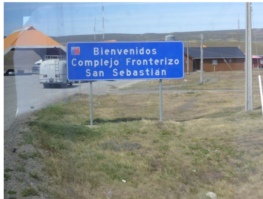
チリからアルゼンチンへ出国。